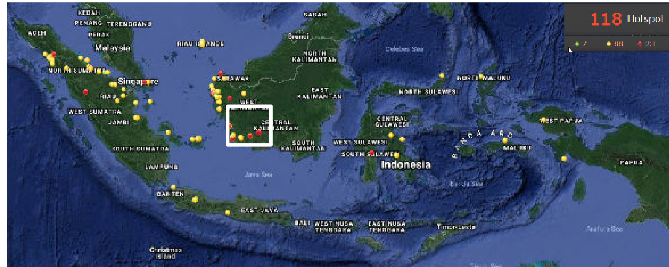
Hotspot tanggal 18-02-2018