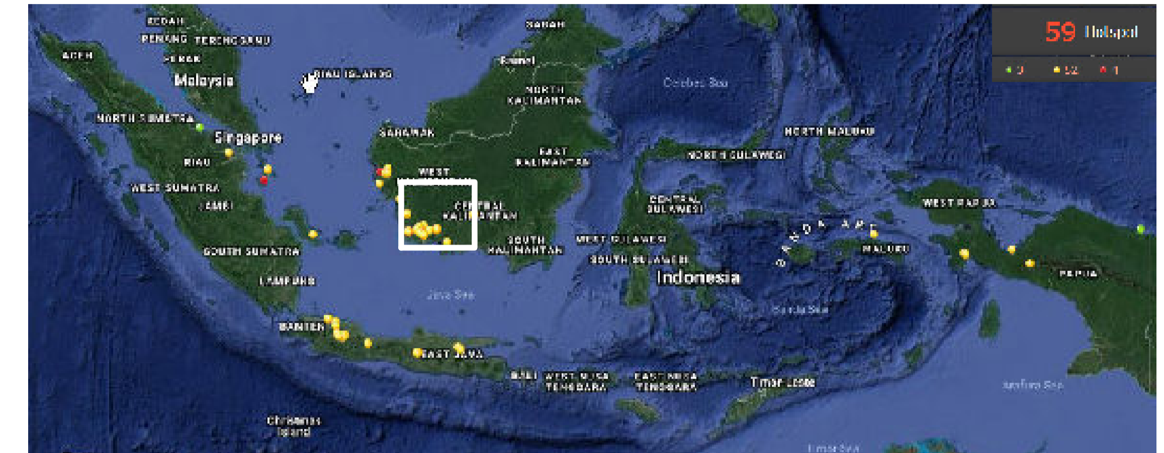
Hotspot tanggal 20-02-2018 (s/d jam 14.00 WIB)