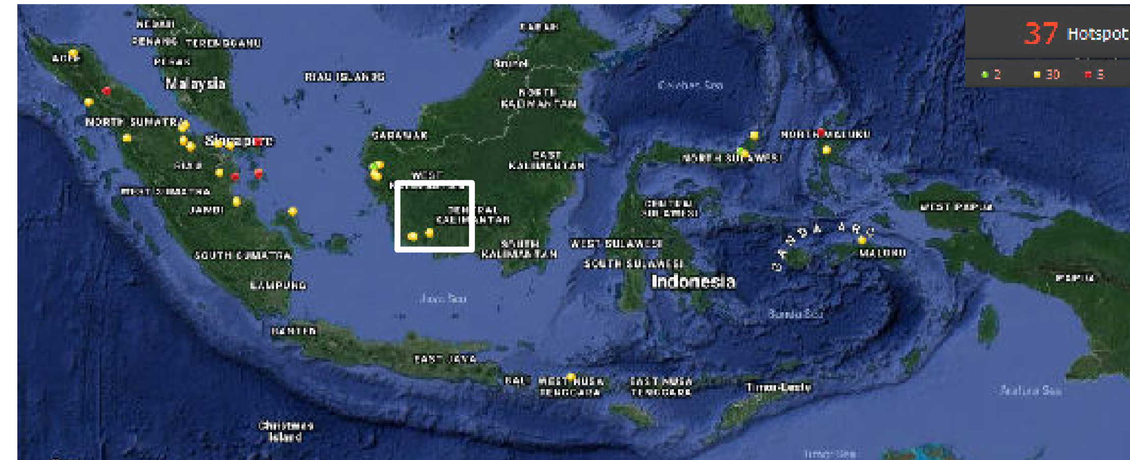
Hotspot tanggal 19-02-2018